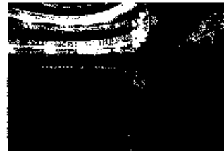
El Teatre Fortuny

L'òpera, dirigida per Rafael Duran, inscriu els seus sis quadres lírics, de formant mitjà, en una Venècia emmarcada per la Belle époque. L'escenografia revela amb els símbols visuals de la factoria Fortuny –obra fotogràfica i videogràfica de Claudio Zulian- les ambicions i els conflictes íntims de l'artista entre llibertat i economia, natura i llenguatges de l'art, creació i burocràcia i disseny i empresa.