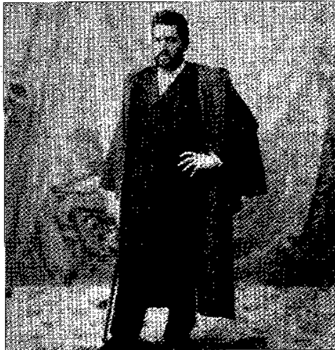
Mariano Fortuny Madrazo. La ópera Fortuny Venise, que se representa esta noche en el Teatro Principal de Castellón, abordará la figura del polifacético pintor y diseñador granadino.