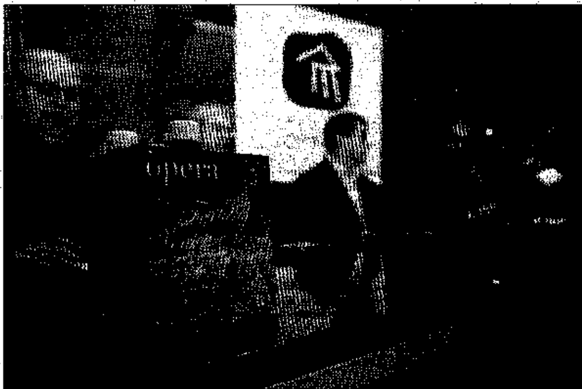
Los creadores de este proyecto musical presentaron la obra junto al director de Castelló Cultural.