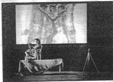
EXPRESIÓN. Una de las escenas de marcada sensualidad.

una tensión comprometida, que trata de hacer vivenciar el compromiso creador del protagonista y el mantenimiento de su empeño a lo largo del tiempo. Precisamente letra y música coinciden en la valoración de esos tiempos diversos que sufren los avatares de un tema no épico: uso verdiano, pero si humano e el heroísmo de la creatividad.